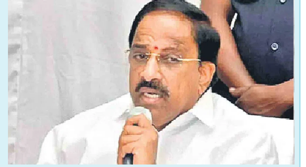
పంద్రాగస్టు లోపు రుణ మాఫీ చేస్తామని చెప్పారు.

నమస్తే హైదరాబాద్ : హైదరాబాద్ : ఇటీవల కురిసిన అకాల వర్షాలకు రైతులు ఆందోళన చెందవద్దని, తడిసిన ధాన్యాన్ని మద్దతు ధరకు ప్రభుత్వం కొనుగోలు చేస్తుందని వ్యవసాయ శాఖ మంత్రి తుమ్మల నాగేశ్వరరావు అన్నారు. కిసాన్ మోర్చా సమావేశంలో పాల్గొన్న మంత్రి మాట్లాడుతూ.. రైతులెవరు అధైర్య పడవద్దన్నారు. రైతుల సంక్షేమానికి ప్రభుత్వం కట్టుబడి ఉందన్నారు. ఇక నుంచి పంటలకు ప్రభుత్వం బీమా ప్రీమియం చెల్లిస్తుందని స్పష్టం చేశారు. రాబోయే బడ్జెట్ సమావేశం తర్వాత రైతు భరోసా కింద రూ. 15 వేలు ఇస్తామని పేర్కొన్నారు. అలాగే