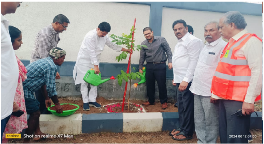
సానుకూలంగా స్పందించారు జోనల్ కమిషనర్ అపూర్వ చౌహాన్. ఈ కార్యక్రమంలో నాయకులు, కార్యకర్తలు, మహిళా నాయకులు, అసోసియేషన్ సభ్యులు మరియు కాలనీ ప్రజలు పాల్గొన్నారు.

నమస్తే హైదరాబాద్ (కూకట్ పల్లి): స్వచ్ఛధనం - పచ్చదనంలో భాగంగా కె.పి. హెచ్.బి. కాలనీలో ఎమ్మెల్యే మాధవరం కృష్ణారావు, జోనల్ కమిషనర్ అపూర్వ చౌహాన్, కార్పొరేటర్ మందడి శ్రీనివాసరావు మొక్కలు నాటారు. వర్షం నీటి వల్ల, డ్రైనేజీ వల్ల, వన్ సీటీ, లోడ, మలేషియన్ టౌన్ షిప్ ప్రాంతాలలో ప్రజలు ఇబ్బందులు పడుతున్న దృష్ట్యా ఆ ప్రాంతాన్ని పరిశీలించారు.. - కె.పి. హెచ్.బి కాలనీ లోని 1వ ఫేస్, 3వ ఫేస్, 7వ ఫేస్ లోని డాబి ఘాట్ లను మోడల్ డోబి ఘాట్ లుగా ఏర్పాటు చేసే విధంగా చర్యలు తీసుకోవాలని ఆ ప్రాంతాన్ని పరిశీలించిన అనంతరం అధికారులకు తెలిపారు - వర్షాలు వచ్చినప్పుడు డోబి ఘాట్ వద్ద ప్రజలు ఇబ్బందులు పడుతున్నారు అని అన్నారు. ఈ సందర్భంగా వీలైనంత త్వరగా పనులు చేపడతామని