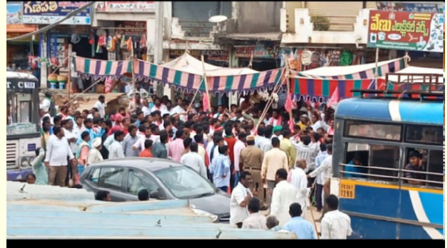
(నమస్తే హైదరాబాద్ తిరుమలగిరి) తిరుమలగిరి మున్సిపల్ కేంద్రంలోని తెలంగాణ చౌరస్తాలో గురువారం రణ