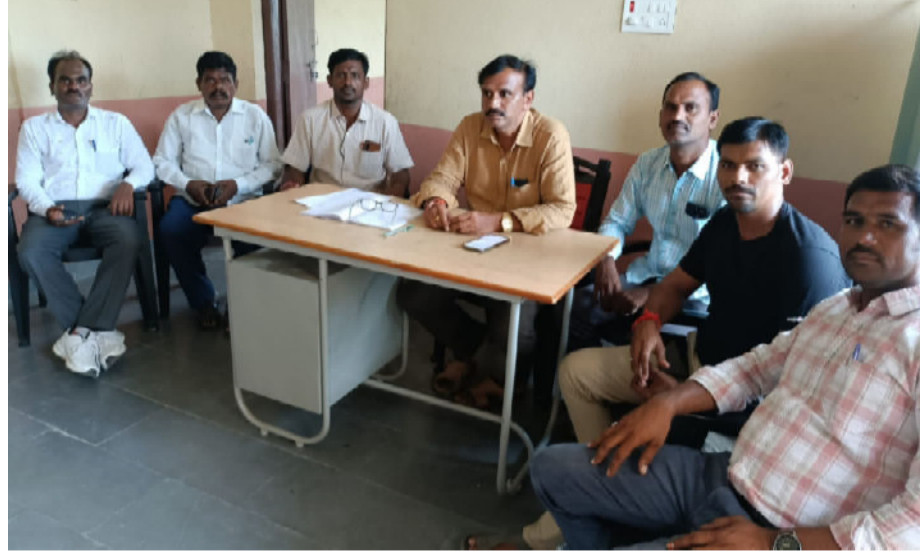
నాగారం నమస్తే హైదరాబాద్ : (ఆగస్టు 22) నాగారం మండల స్థాయి పాఠశాల ఆటల

ఆగస్టు 30, 31వ తేదీలలో ఎస్ జి ఎఫ్ క్రీడోత్సవాలు