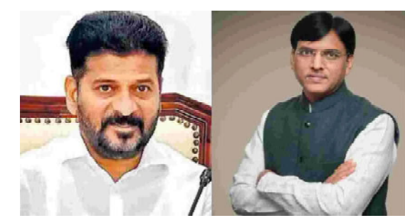
కలిసి సీఎం భేటీ అయ్యారు. 2లో

నమస్తే హైదరాబాద్ : ఢిల్లీ: ఒలింపిక్స్, ఆసియన్, కామన్వెల్త్ గేమ్స్ వంటి జాతీయ, అంతర్జాతీయ క్రీడలు తెలంగాణ రాష్ట్రంలో నిర్వహించేలా చర్యలు తీసుకోవాలని కేంద్ర క్రీడల శాఖ మంత్రి మనుసుఖ్ మాండవీయను ముఖ్యమంత్రి రేవంత్ రెడ్డి కోరారు. ఖేలో ఇండియా యాత్ గేమ్స్-2025కు హైదరాబాద్ ను వేదిక చేయాలని ముఖ్యమంత్రి విజ్ఞప్తి చేశారు. ఈ మేరకు కేంద్రమంత్రి మనుసుఖ్ మాండవీయాను డిప్యూటీ సీఎం భట్టి విక్రమార్కు రాష్ట్ర పర్యటకు, ఎవ్రెజ్ శాఖ మంత్రి జూపల్లి కృష్ణారావుతో