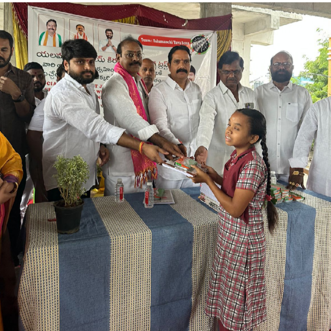
నమస్తే హైదరాబాద్, శేరిలింగంపల్లి స్వాస్థ్య: చిన్నతనంలోనే విద్యార్థులకు