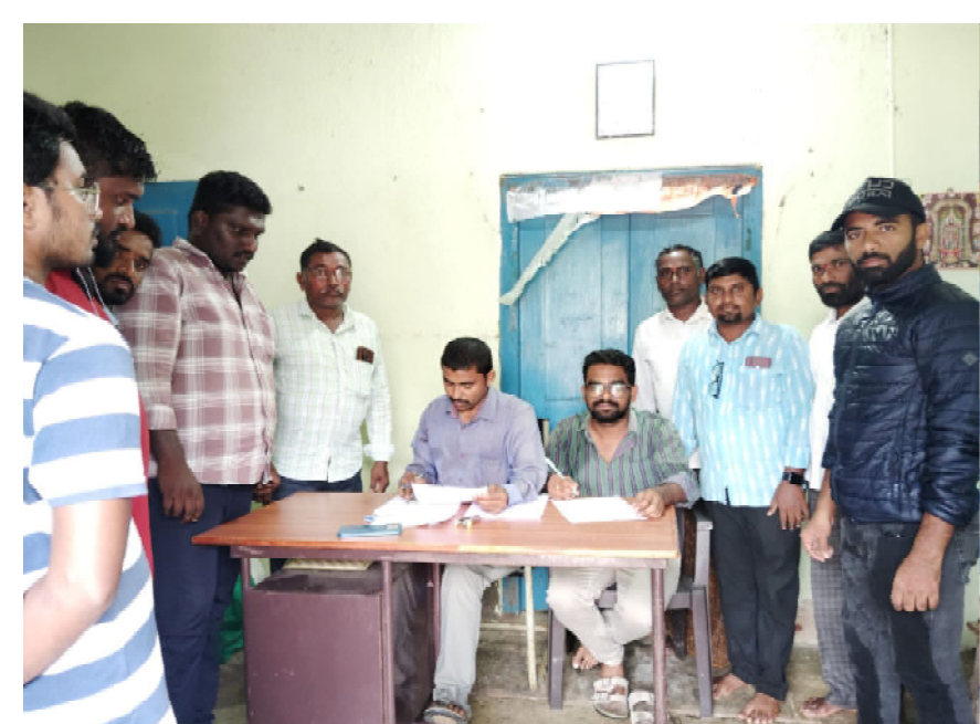
నాగారం, నమస్తే హైదరాబాద్: (సెప్టెంబర్ 3) మండల పరిధిలోని లక్ష్మీపురం గ్రామంలో