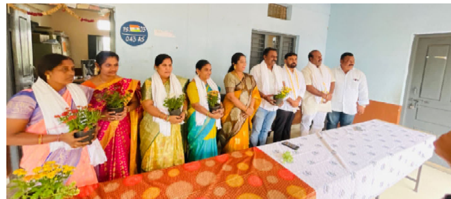
మేడిపల్లి (నమస్తే హైదరాబాద్): ఉపాధ్యాయ దినోత్సవం సందర్భంగా పీఠాధిగూడ మున్సిపల్ కార్పొరేషన్ 5వ డివిజన్ లోని ప్రభుత్వ ప్రాథమిక పాఠశాలలో హా ఏర్పాటుచేసిన ఉ