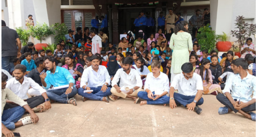
సప్తపోయారని వారు ఆవేదన వ్యక్తం చేశారు. అలాగే డిటెన్షన్ విధానం వలన చాలా మంది విద్యార్థులు డిటెన్డ్ అయ్యారు కావున వారు చదువులకు దూరం కాకుండా ఆయా విద్యార్థులకు న్యాయం చేయాలని విద్యార్థులు రిజిస్ట్రార్ గారికి వినతిపత్రం ఇవ్వడం జరిగింది. విద్యార్థుల సమస్యలపై స్టాండింగ్ కమిటీలో చర్చించి విద్యార్థులకు న్యాయం జరిగేలా చర్యలు తీసుకుంటామని హామీ ఇచ్చారు. ఈ కార్యక్రమంలో వివిధ డిగ్రీ కళాశాల విద్యార్థులు పాల్గొన్నారు.