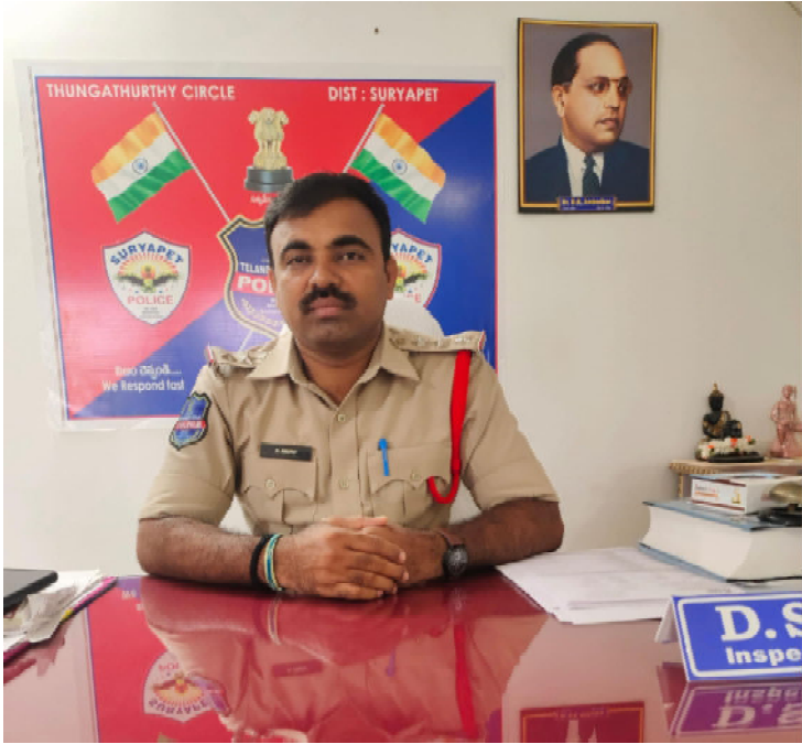
పూజించేందుకు ప్రాధాన్యం ఇవ్వాలని తెలిపారు.