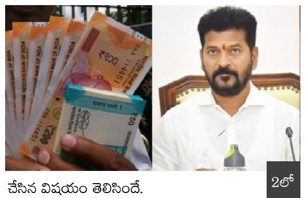
చేసిన విషయం తెలిసింది.

సమస్తే హైదరాబాద్ : తెలంగాణ ఏర్పడిన పదేళ్ల తర్వాత కాంగ్రెస్ పార్టీ అధికారంలోకి వచ్చింది. రెండు సార్లు బీఆర్ఎస్ పార్టీనే అధికారం చేపట్టగా.. మూడోసారి కాంగ్రెస్ సర్కార్ అధికారం రుచిచూసింది. అయితే.. అధికారంలోకి వచ్చిన కాంగ్రెస్ సర్కార్.. బీఆర్ఎస్ పార్టీపై తీవ్ర విమర్శలు, సంచలన ఆరోపణలు చేస్తూనే ఉంది. అందులో ముఖ్యంగా ఆప్పుల విషయంలో.. నిత్యం విమర్శిస్తూనే ఉంది. మిగులు బడ్జెట్ రాష్ట్రంగా ఏర్పడిన తెలంగాణను.. ఆప్పుల కుప్పగా మార్చేశారని దుర్ముఖుడంటూనే ఉంది. రాష్ట్రంలో చేపట్టిన ప్రతి పనిలో అవినీతి చేసిందని.. లక్షల కోట్లు అప్పు చేసి ప్రజలపై తీవ్ర భారం వేసిందంటూ విమర్శలు చేస్తోంది. కేసీఆర్ సర్కార్ చేసిన అడ్డగోలు అప్పులకు.. రాష్ట్రంలో వచ్చే ఆదాయం వడ్డీ కట్టేందుకే సరిపోతుందంటూ సీఎం రేవంత్ రెడ్డి పలుమార్లు విమర్శలు