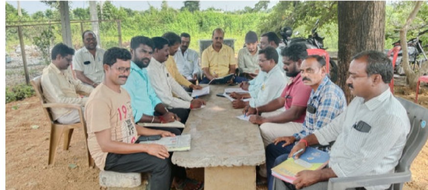
నాగారం, నమస్తే హైదరాబాద్: (సెప్టెంబర్ 13) అక్రమ కనక్లన్ల ద్వారా విద్యుత్ చోరీకి