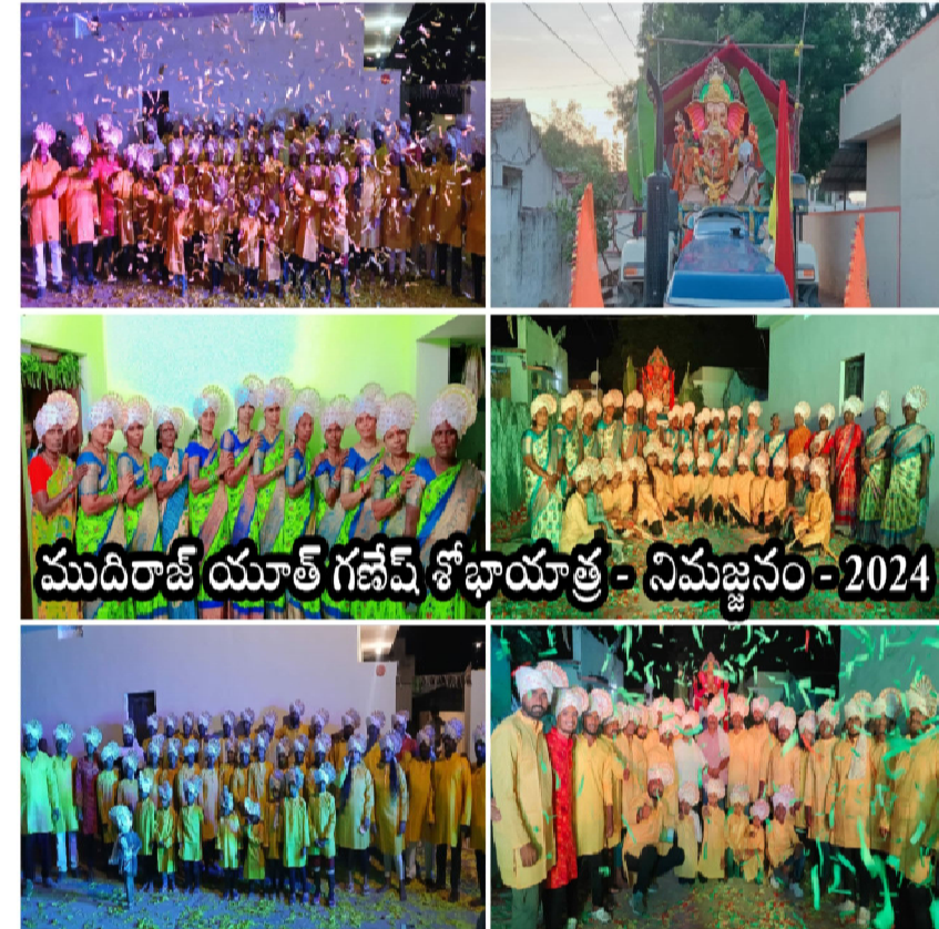
ముదిరాజ్ యూత్ గణేష్ శోభాయాత్ర - నిమజ్జనం - 2024

యాదాద్రి/మోటకొండూరు/రాయల్ పోస్ట్ సెప్టెంబర్ 16