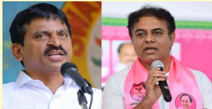
కేటీఆర్ రాజీనామా చేస్తారా? అని ఛాలెంజ్ చేశారు. ఆరోపణలు నిరూపించకపోతే కేటీఆర్ చట్టపరంగా చర్యలు తీసుకోవాల్సి ఉంటుందన్నారు.