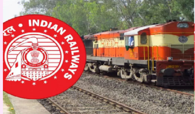
శ్రీనగర్, కోల్ కతా, మాలా, ముంబయి, ముజఫర్ పూర్, పట్నా ప్రయాగ్ రాజ్, రాంచీ, సిలిగురి, తిరువనంతపురం రిజియన్లలో భర్తీ చేస్తారు. ఆర్ఆర్బీ సికింద్రాబాద్ లో 89 వరకు పోస్టులు ఉన్నాయి.

నమస్తే హైదరాబాద్ : భారత ప్రభుత్వ రైల్వే మంత్రిత్వ శాఖ ఆధ్వర్యంలో దేశ వ్యాప్తంగా ఉన్న అన్ని రైల్వే జోన్స్ లో వివిధ నాన్-టెక్నికల్ పాపులర్ కేటగిరీ (అండర్ గ్రాడ్యుయేట్)లకు సంబంధించి ఉద్యోగాల భర్తీకి రైల్వే రిక్రూట్ మెంట్ బోర్డు (%=ది%) నోటిఫికేషన్ విడుదల చేసింది. ఎన్టీపీసీ అండర్ గ్రాడ్యుయేట్ కేటగిరీలో మొత్తం 3,445 కమర్షియల్ కమ్ టికెట్ క్లర్క్, అకౌంట్స్ క్లర్క్ కమ్ టైపిస్ట్, ట్రైన్స్ క్లర్క్, జూనియర్ క్లర్క్ కమ్ టైపిస్ట్ పోస్టులను భర్తీ చేయనుంది. ఈ పోస్టులను సికింద్రాబాద్ తో సభా అమ్మదాబాద్, అజ్మీర్, బెంగళూరు, భోపాల్, భువనేశ్వర్, బిలాస్ పూర్, చండీగఢ్, చెన్నై, గువాహాటి, గోరఖ్ పూర్, జమ్ము