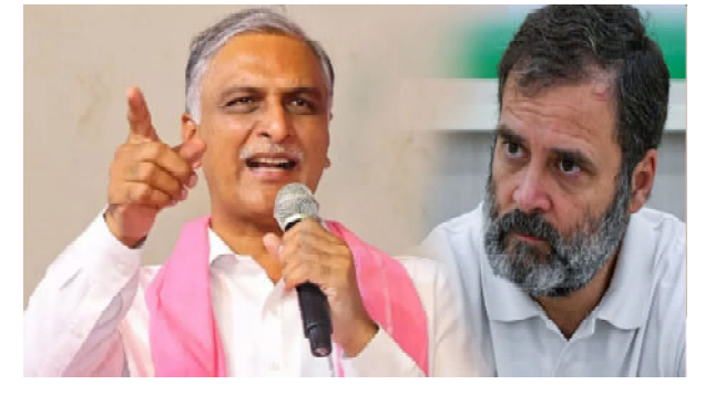
టార్గెట్ చేస్తూ, భయభ్రాంతులకు గురి చేస్తూ బుల్డోజర్ పాలన నడుపుతున్నట్లు పేర్కొన్నారు.

సమస్తే హైదరాబాద్ : తెలంగాణలో బుల్డోజర్ రాజ్యం నడుస్తుందంటూ లోకసభ ప్రతిపక్ష నేత, కాంగ్రెస్ జాతీయ నాయకులు రాహుల్ గాంధీకి మాజీ మంత్రి హరీష్ రావు బహిరంగ లేఖ రాశారు. తెలంగాణలో డాక్టర్ బాబా సాహెబ్ అంబేద్కర్ రచించిన రాజ్యాంగం ఆధారంగా కాకుండా, అధికార దుర్వినియోగంతో దుర్భా, దుష్ట పాలన నడుస్తుందని ఆయన పేర్కొన్నారు. తెలంగాణ కాంగ్రెస్ ప్రభుత్వం మానవత్వాన్ని, న్యాయాన్ని బుల్డోజర్ కింద తొక్కి అణచివేస్తూ, రాజ్యాంగ విరుద్ధ చర్యలకు పాల్పడుతున్నట్లు లేఖలో విమర్శించారు. మూసి రివర్ ప్రెస్, హైద్రా ప్రాజెక్టుల విషయంలో హైకోర్టు చేసిన వ్యాఖ్యలే దీనికి నిదర్శనమన్నారు. తమ పార్టీ ముఖ్యమంత్రి రేవంత్ రెడ్డి ఆధ్వర్యంలో నడుస్తున్న నిరంకుశ పాలనకు బుల్డోజర్ ప్రతీకగా మారినట్లున్నారు. అది తెలంగాణలో పౌరహక్కులను నిరంతరం ధిక్కరిస్తోందన్నారు. హైద్రా, మూసి రివర్ ప్రెస్ ప్రాజెక్టుల పేరుతో పేద, మధ్యతరగతి కుటుంబాలను రోడ్డున పడేస్తున్నారని ఆవేదన వ్యక్తం చేశారు. ఏళ్లుగా అన్ని చట్టపరమైన పత్రాలతో నివసిస్తున్న వారి ఇళ్లను