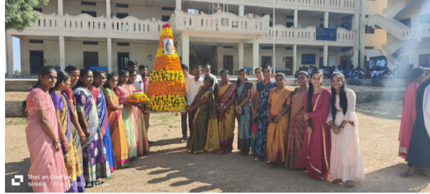
దేవరపుల ( నమస్తే హైదరాబాద్) దేవరపుల మండల కేంద్రంలోని శ్రీ సాయి