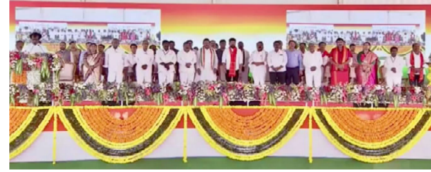
షాద్ నగర్ ఎమ్మెల్యే వీరపల్లి శంకర్, ప్రభుత్వ చీఫ్ విప్ పట్నం మహేందర్ రెడ్డి, పరిగి ఎమ్మెల్యే రామ్మోహన్ రెడ్డి, చేవెళ్ల ఎమ్మెల్యే కాలే యాదయ్య, టీపీసీసీ అధికార ప్రతినిధి డా. సత్యం శ్రీరంగం. ఈ సందర్భంగా సత్యం శ్రీరంగం మాట్లాడుతూ రాష్ట్రంలో కులమతాలకు అతీతంగా అందరికీ ఒకే చోట అంతర్జాతీయ స్థాయి సౌకర్యాలతో అత్యంత ప్రామాణికమైన విద్యను అందించేందుకు రాష్ట్ర ప్రభుత్వం యంగ్ ఇండియా సమీకృత గురుకులాలు నిర్మించడం చాలా గర్వంగా ఉందని, మొత్తం 25 ఎకరాల విస్తీర్ణంలో ఏర్పాటు

చేసే ఈ పాఠశాలలు నాలుగు నుండి పన్నెండవ తరగతి వరకు అంతర్జాతీయ ప్రమాణాలతో విద్యాబోధన అందించడంతో పాటు ఒక్కో లైబ్రరీలో ఐదు వేల పుస్తకాలు, అరవై కంప్యూటర్లు, తరగతి గదుల్లో డిజిటల్ బోర్డులు మరియు ప్రత్యేకంగా స్పోర్ట్స్ గ్రౌండ్ ను కూడా ఏర్పాటు చేస్తుందని అన్నారు. పేద విద్యార్థులకు కార్పొరేట్ స్థాయి విద్యను అందించేందుకు చర్యలు, తెలంగాణ పేద విద్యార్థులకు నాణ్యమైన విద్యను అందించాలనే ఉద్దేశ్యంతో కాంగ్రెస్ ప్రజా ప్రభుత్వం పనిచేస్తుందని అన్నారు. బిఆర్ఎస్ ప్రభుత్వం ఐదు వేల పాఠశాలలను మూసివేసిందని, పేదలకు విద్యను దూరం చేయాలన్న కుట్రతో బిఆర్ఎస్ సర్కార్ పనిచేసిందని అన్నారు.