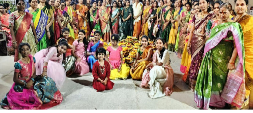
సంస్కృతి తెలంగాణకే సొంతమని, ఇలాంటి మన గొప్ప సంస్కృతిని భవిష్యత్ తరాలకు అందించాలని , బోడుప్పల్ ప్రజలందరికీ సద్గుల బతుకమ్మ, దసరా శుభాకాంక్షలు తెలుపుతున్నానని అన్నారు. కార్యక్రమంలో డివిజన్ నాయకులు కాలనీ మహిళలు, అధిక సంఖ్యలో పాల్గొన్నారు.