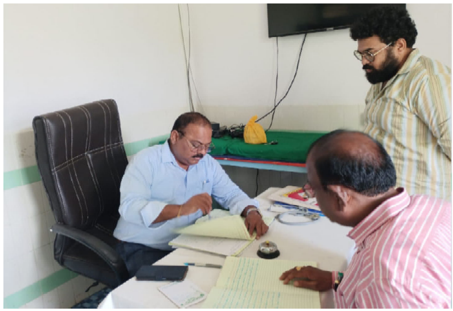
నాగారం, నమస్తే హైదరాబాద్ : (అక్టోబర్ 21) నాగారం మండలం కేంద్రంలోని ప్రాథమిక