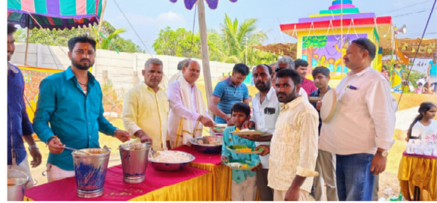
నమస్తే హైదరాబాద్ : తుర్కపల్లి మండలం పల్లె పహాద్ గ్రామంలో శ్రీ రేణుక ఎల్లమ్మ