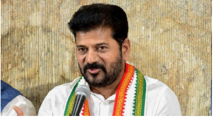
భట్టి విక్రమార్క, వైద్యా ఆరోగ్య శాఖ మంత్రి దామోదర రాజనర్సింహులకు ధన్యవాదాలు తెలిపారు.

నమస్తే హైదరాబాద్ : సిద్దిపేట : హుస్సాబాద్ నియోజకవర్గ ప్రజలకు దీపావళి గాడు తెలంగాణ ప్రభుత్వం శుభవార్త తెలిపింది. హుస్సాబాద్ ఎమ్మెల్యే, రాష్ట్ర రవాణా మంత్రి పొన్నం ప్రభాకర్ చౌరవతో హుస్సాబాద్ లోని 100 పడుకల ఆస్పత్రిని 250 పడకల ఆస్పత్రిగా మారుస్తూ కాంగ్రెస్ ప్రభుత్వం ఉత్తర్వులు జారీ చేసింది. ఈ మేరకు దీపావళి కానుకగా ప్రకటించింది. రూ. 82.00 కోట్లను రేవంత్ ప్రభుత్వం విడుదల చేసింది. ఈ మేరకు రాష్ట్ర హెల్త్, మెడికల్, ఫ్యామిలీ వెల్ఫేర్ డిపార్ట్మెంట్ నిధులు విడుదల చేస్తూ పరిపాలన అనుమతులు జారీ చేసింది.. హుస్సాబాద్ కి 250 పడకల ఆస్పత్రి రావడం పట్ల నియోజకవర్గ ప్రజలు హర్షం వ్యక్తం చేస్తున్నారు. ఈ సందర్భంగా మంత్రి పొన్నం ప్రభాకర్ మీడియా సమావేశం ఏర్పాటు చేసి ఇందుకు సంబంధించిన వివరాలు తెలిపారు. హుస్సాబాద్ ఆస్పత్రిని 250 పడకల ఆస్పత్రిగా మార్చడానికి సహకరించిన ముఖ్యమంత్రి రేవంత్ రెడ్డి, ఉప ముఖ్యమంత్రి