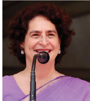
రాహుల్ గాంధీ ఆమెపై నుంచి ఎంపీగా కొనసాగాలని నిర్ణయించుకోవడంతో ఈ వివాది ప్రారంభంలో వరువాన్ సీమీను ఖాళీ చేశారు. దీంతో జరిగిన ఉప ఎన్నికల్లో ప్రియాంక గాంధీ బరిలోకి దిగి చరిత్ర సృష్టించారు.