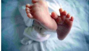
సమస్తి హైదరాబాద్ : హైదరాబాద్ నీలోఫర్ ఆస్పత్రిలో నెల రోజుల పసికందును గుర్తుతెలియని మహిళ కిడ్నాప్