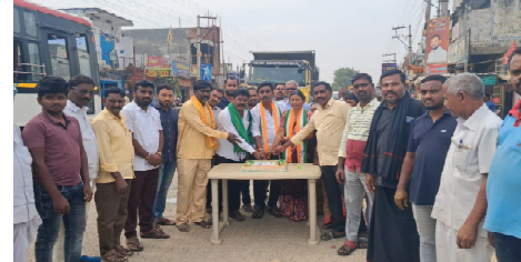
నమస్తే హైదరాబాద్ తుంగతుర్తి ప్రతినిధి నవంబర్ 27: తుంగతుర్తి ఎమ్మెల్యే మండల