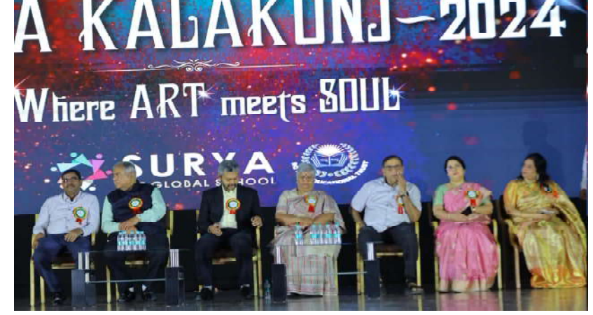
ప్రముఖులతో పాటు పాఠశాల వ్యవస్థాపక, అధ్యాపక బృందం, విద్యార్థులు, తల్లిదండ్రులు పాల్గొన్నారు.