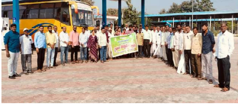
ను సిబ్బందిని వివరాలు అడిగి తెలుసుకొన్నారు.