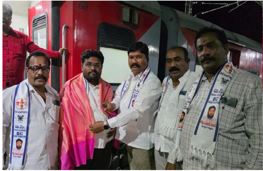
హనుమకొండ మార్చి 19 నమస్తే హైదరాబాద్