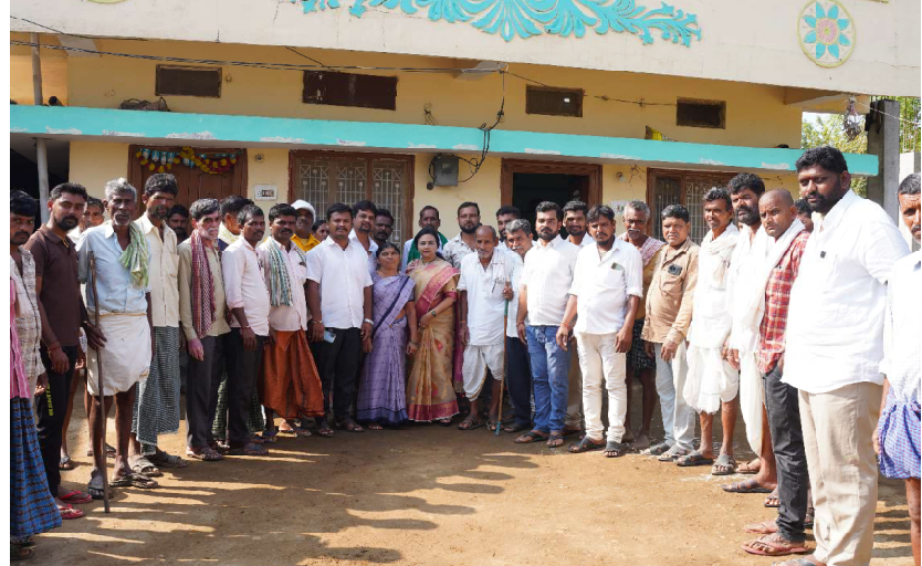
మండల కాంగ్రెస్ పార్టీ అధ్యక్షుడు, అనుబంధ సంఘాల నాయకులు, యువజన నాయకులు, సోషల్ మీడియా కోఆర్డినేటర్లు, స్థానిక ప్రజలు, తదితరులు, పాల్గొన్నారు.