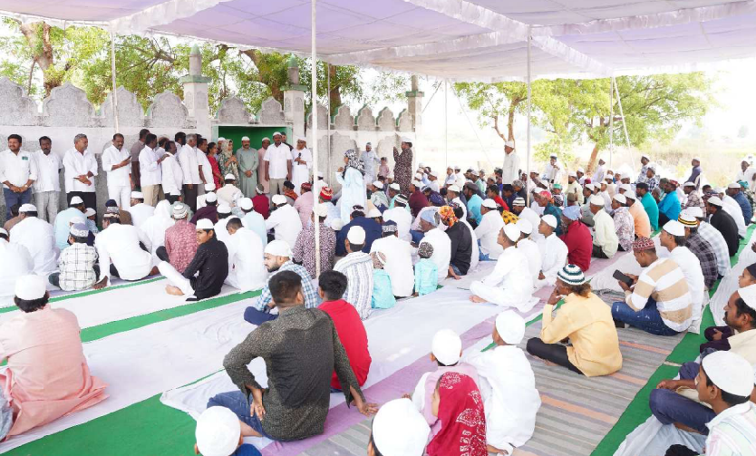
నమస్తే హైదరాబాద్ : రంజాన్ మాసం అనేది నిస్వార్థతకు, ఉపవాసానికి, ఆధ్యాత్మిక