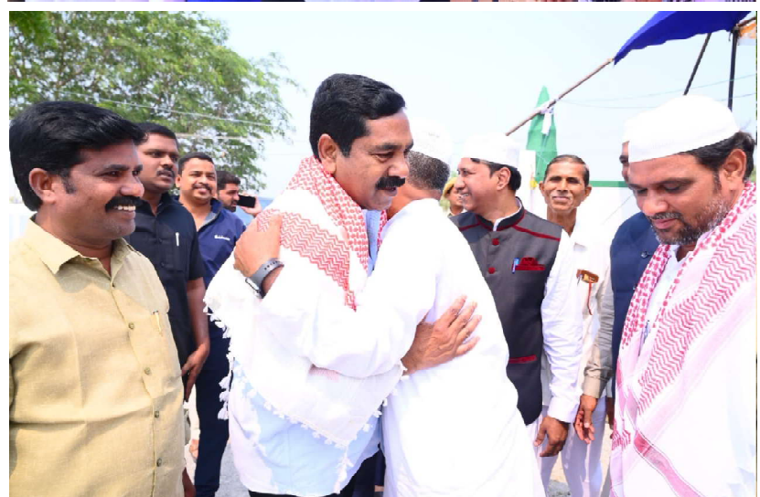
నమస్తే హైదరాబాద్ : రంజాన్ ఒక పవిత్రమైన పండుగ అని, మానవ సేవ చేయాలన్న