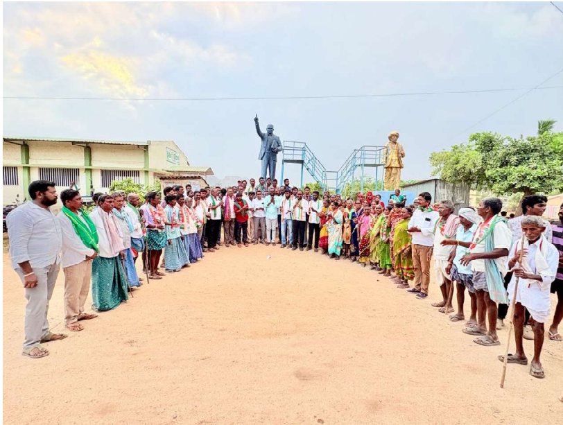
నమస్తే హైదరాబాద్ తుంగతుర్తి ప్రతినిధి ఏప్రిల్ 10: