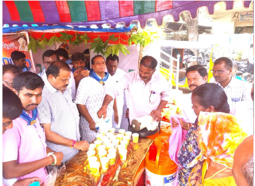
సత్యసాయి సేవా సమితి సభ్యులు పాల్గొన్నారు