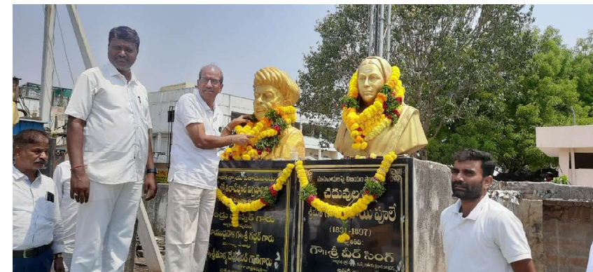
నమస్తే హైదరాబాద్ :