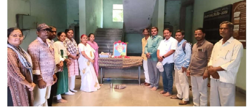
నమస్తే హైదరాబాద్ :