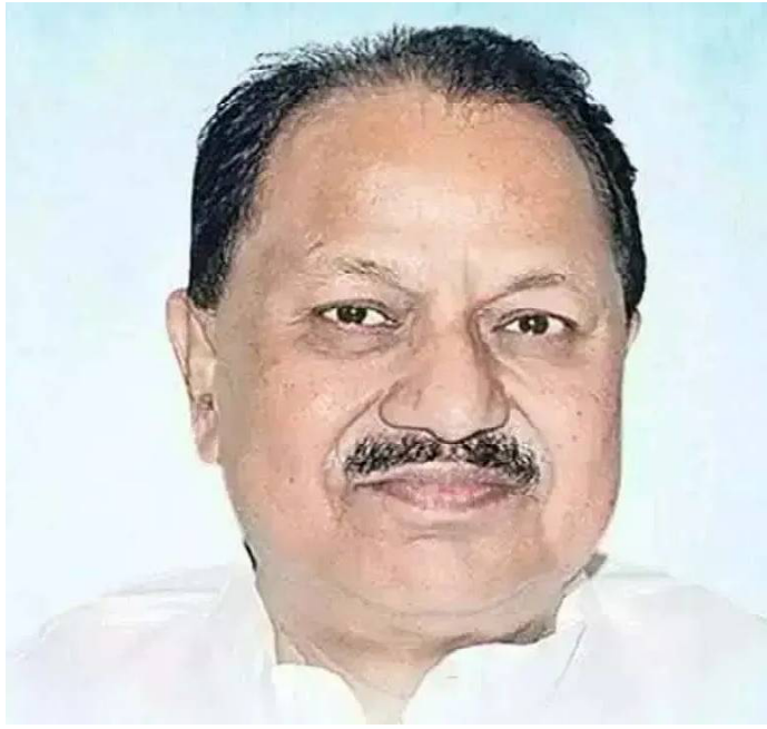
మాజీ పార్లమెంటు సభ్యులు, మాజీ మంత్రి, దివంగత నేత ధర్మపురి శ్రీనివాస్..తెలంగాణ రాజకీయాల్లో చక్రం తిప్పిన నేత, కాంగ్రెస్

పార్టీలో దీర్ఘకాలం పనిచేసి, మూడు సార్లు ఎమ్మెల్యేగా, ఒకసారి ఎంపీగా ఎన్నికయ్యారు. టీఆర్ఎస్ ఆవిర్భావంలో కీలక పాత్ర పోషించిన శ్రీనివాస్, తర్వాత కాంగ్రెస్లోకి వెళ్లారు. 2021లో బీజేపీలో చేరినా యాక్టివ్ పాటిలిక్స్ కు దూరంగానే ఉన్నారు. తర్వాత కాంగ్రెస్లోకి మారారు. తర్వాత వెంటనే రాజీనామా చేశారు. ఇప్పుడాయన ఎవరివాడు.. అన్నదానిపై కాంగ్రెస్ బీజేపీ మధ్య క్రెడిట్ వార్ నడుస్తోంది. డీఎస్ వర్గంతో సందర్భంగా నిజామాబాద్లో డీఎస్ విగ్రహవిష్కరణ జరిగింది. కేంద్రమంత్రి, బీజేపీ లీడర్ అమిత్ షా డీఎస్ విగ్రహాన్ని ఆవిష్కరించారు. డీఎస్ తమ పార్టీకి చెందినవారేనని బీజేపీ నేతలు చెప్పకొస్తున్నారు. చనిపోయేముందు కాంగ్రెస్లో చేరినా.. వెంటనే రాజీనామా చేశారని, ఆయనకు కాంగ్రెస్లో ఉండటం ఇష్టం లేకనే ఆపార్టీ నుంచి బయటకు వచ్చారంటోంది కమలం. డీఎస్ విగ్రహాన్ని ఆవిష్కరించే అర్హత తమ పార్టీకే ఉందన్నది బీజేపీ వాదన. మరోవైపు డీఎస్ విగ్రహ ఏర్పాటు స్వాగతిస్తున్నా.. బీజేపీ నేతలు ఆవిష్కరించడంపై కాంగ్రెస్లో తీవ్ర వ్యతిరేకత వ్యక్తమవుతోంది. డీఎస్ తమ పార్టీ నాయకుడు కాబట్టే ముఖ్యమంత్రి రేవంత్ రెడ్డి విగ్రహానికి స్థలం కేటాయించారని, డీఎస్.. చనిపోయేవరకు కాంగ్రెస్ వాదిగానే ఉన్నారు.. బీజేపీ సిద్ధాంతాలను తీవ్రంగా వ్యతిరేకించిన నేతల్లో డీఎస్ ఒకరని.. అలాంటి నేత విగ్రహాన్ని బీజేపీనేతలే ఆవిష్కరించడం బాధాకరమంటోంది కాంగ్రెస్.